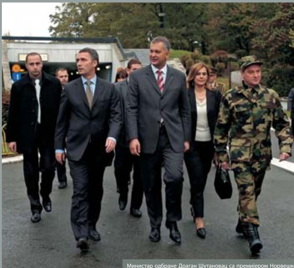
Министар одбране Драган Шутановац са премијером Норвешке Јенсом Столтенбергом у посети Војномедицинској академији